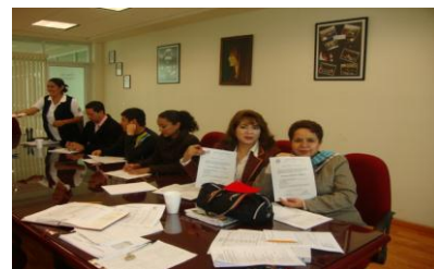
Representantes del Consejo de Unidad