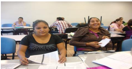
Alumnas del Programa de Enf. Gral.