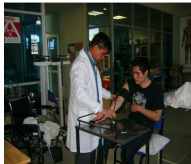
Práctica de Fundamentos de Enfermería

Así mismo el impulso de otras actividades como son: Artísticas y Culturales, un segundo Idioma, Movilidad Estudiantil, Deporte, Verano de la Ciencia.