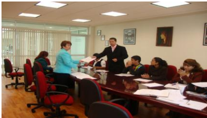
Reunión de Consejo de Unidad

Durante este año el Consejo tuvo a bien avalar convenios, proyectos, compras, foros, talleres, reestructuraciones, programas, realizando un total de 10 reuniones, todos para mejorar, cada uno de los procesos tanto académicos, administrativos, deportivos, culturales para el logro de la calidad de nuestros programas en beneficio de nuestros docentes, alumnos y administrativos, correspondientes al ciclo 2010-2011.