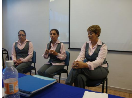
Exámenes Profesionales de Complementario de Convenio en Aguascalientes

Matricula- Total de 170 alumnos Egresaron 168 Titulados