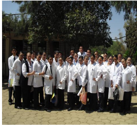
En Practicas Enf. Comunitaria

La unidad Académica de enfermería como uno más de sus compromisos con la excelencia Académica y la Calidad de la Enseñanza y dentro de las funciones sustantivas plasmadas en el Plan de Desarrollo se realizaron las siguientes actividades como parte integral de su formación y superación: