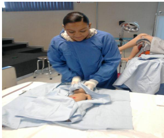
Prácticas de Laboratorio.

Asistencia y participación en el Centro de aprendizaje de Competencias para la Práctica Clínica Integral "Hospital Virtual" los alumnos de los diferentes semestres.