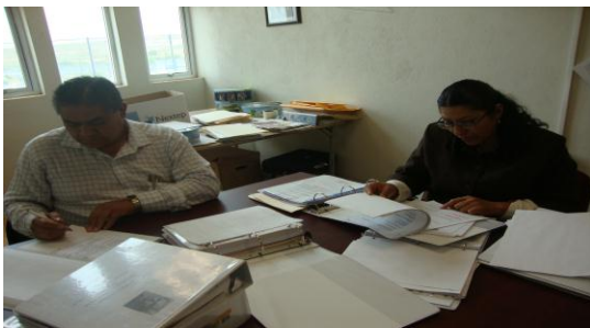
Mesas de Trabajo