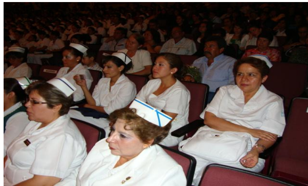
Alumnos y docentes en Graduación de Licenciatura en Enfermería y Enfermería General.