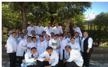
Alumnos con Docente en Practicas Enf. Com.

Proceso único de ingreso Ciclo Escolar 2010-2011, por medio del Examen Nacional de Ingreso a la Educación Superior EXANI-II, presentaron 502 de los cuales fueron aceptados 370, que fue primera opción.